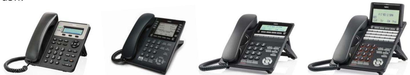
Mono: einfache Anrufsteuerung vom Büro aus

Eine vollständige Liste aller Mobilteile für das SV9100 und weitere Informationen finden Sie auf www.nec-enterprise.com .